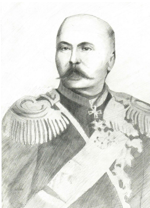
Рис. 1. Генерал-лейтенант Кубанского казачьего войска Иван Диомидович Попко. 1819–1893 гг. (неизвестный художник) (Дубинин, Иванцов, 2018: фронтиспис)

Источником данного исследования стали архивные дела ГАСК (фонд 377). В фонде сохранилась переписка будущего генерала, в том числе и личные письма Ивана Диомидовича Попко, адресованные его другу В.Ф. Золотаренко. Хронологически они охватывают период с 1847 по 1855 гг. и представляют собой ценный материал для исследования повседневной жизни молодого сотника Кубанского казачьего войска в екатеринодарский период его жизни. При написании статьи использовался проблемно-хронологический принцип.